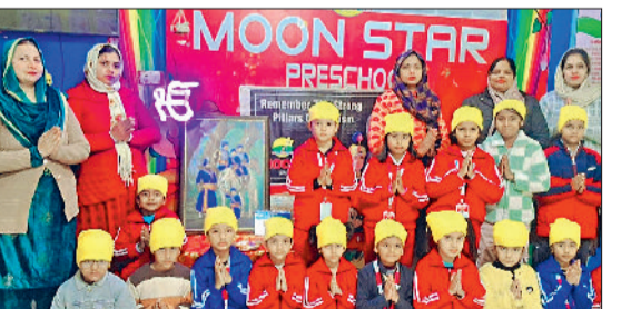
यमुनानगर। कस्बा रादौर के मून स्टार प्री स्कूल में आयोजित कार्यक्रम में भाग लेते बच्चे व स्टाफ सदस्य।