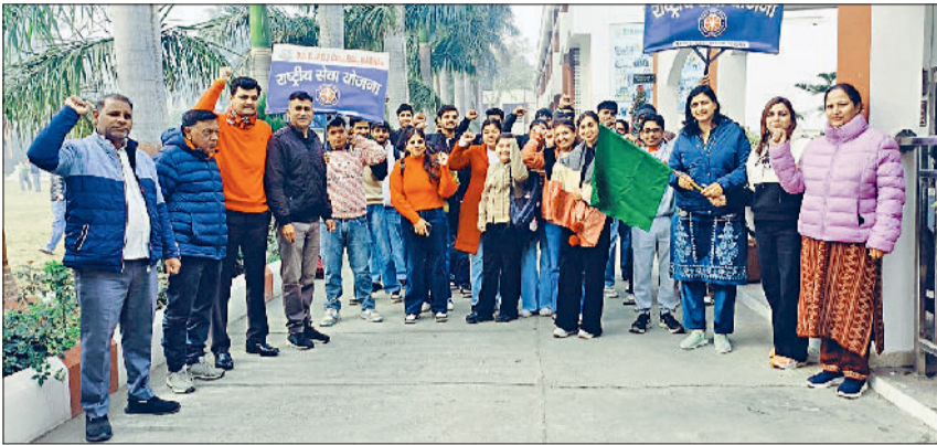
करनाल। वीर बाल दिवस पर डीएवी पीजी कॉलेज में रैली निकालते हुए विद्यार्थी।