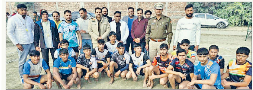
पानीपत। गांव कुराड में पुलिस अधिकारियों के साथ खिलाड़ी।