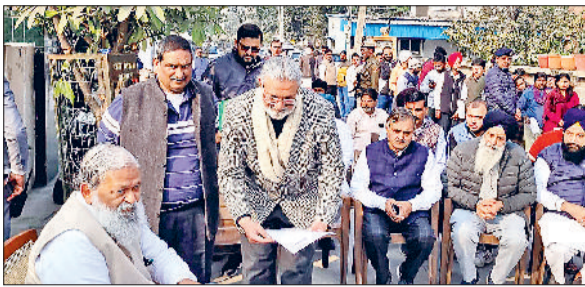
अंबाला। अपने आवास पर लोगों की शिकायतें सुनते ऊर्जा मंत्री अनिल विज।

परिवहन एवं श्रम मंत्री श्री अनिल विज ने महेशनगर में एक व्यक्ति की दुकान में आग लगाने तथा जान से मारने की धमकी देने के मामले में कड़ा संज्ञान लिया है। उन्होंने महेशनगर थाना पुलिस को मामले में तुरंत केस दर्ज करने के निर्देश देते हुए कहा कि जब पीड़िता आरोपियों के नाम स्पष्ट रूप से बता रही है, तो