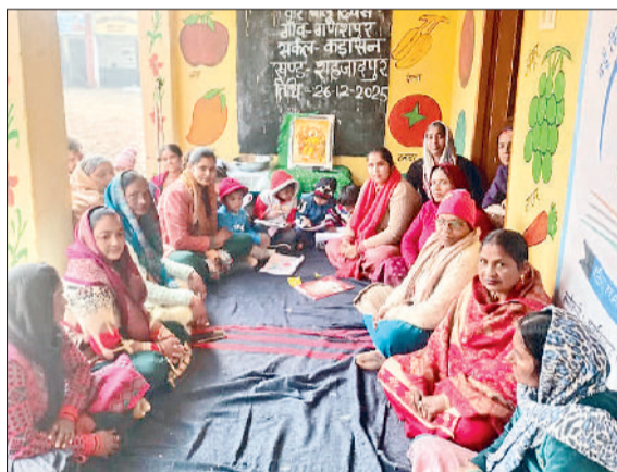
शहजादपुर। साहिबजादों को नमन करते हुए श्रद्धालु।