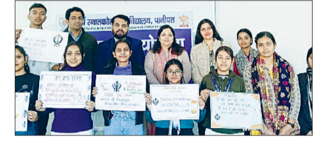
पानीपत। आर्य कॉलेज के विद्यार्थी साहिबजादों की याद में स्लोगन का प्रदर्शन करते हुए।